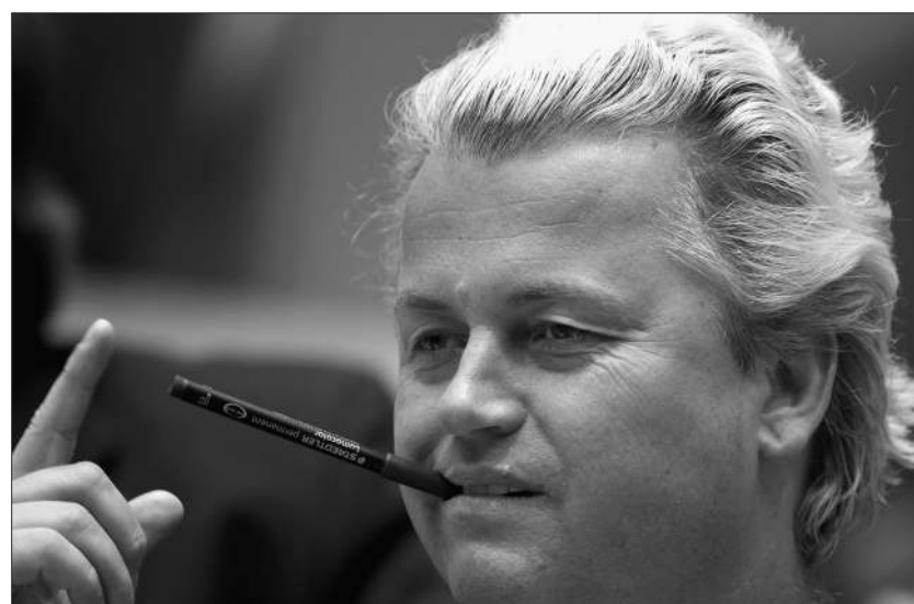
Geert Wilders: Mit Mozart-Frisur gegen Kopftücher.

Im April 2010 rief die PVV ihre «Agenda für Hoffnung und Optimismus» ins Leben, die sich hauptsächlich um Sicherheitsbelange und den Islam dreht. Sie fordert härtere Strafen, 10'000 zusätzliche Polizisten, eine Einschränkung des Entscheidungsspielraums der Richter sowie ein Koran- und Burka-Verbot, einen Einwanderungsstopp für Personen aus islamischen Ländern, keine soziale Unterstützung für Immigrantinnen und Immigranten für die ersten zehn Jahre, eine «Kopftuch-Steuer» oder die Schliessung islamischer Schulen, um nur einige der abstrusen Ideen zu nennen. Ausserdem verlangt die PVV eine «ethnische Registrierung» aller Bürgerinnen und Bürger – und stellt somit die Loyalität der Doppelbürgerinnen und -bürger in Frage. Wilders richtete sein Programm neu