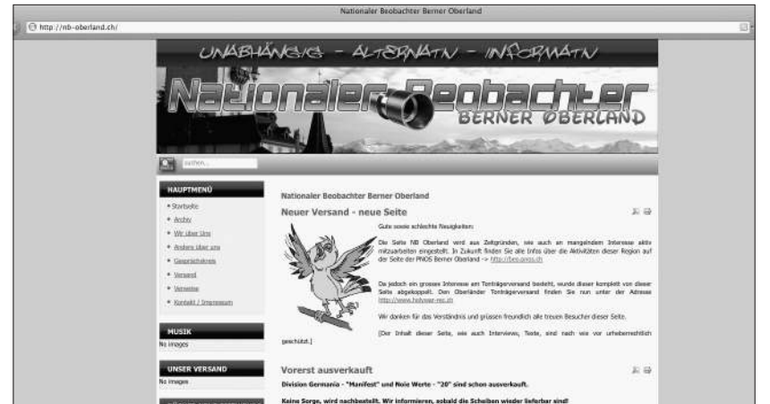
Das Online-Portal «Nationaler Beobachter» ist eingeschlafen.