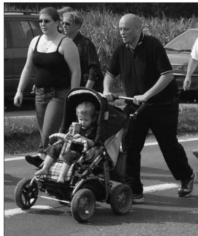
Familie Rechsteiner in Aktion.

Die rechtsextreme, im Oberaargau und ländlichen Luzern beheimatete «Helvetische Jugend» – das Kürzel HJ stand einst auch für die Hitler-Jugend – konnte ihr Aktionsfeld markant ausweiten. Seit dem 21. Juni 2009 verfügt die HJ über einen Ableger im Berner Oberland und betätigt sich mehr denn je als Jugend- und Vorfeldorganisation der PNOS. Der «Nationale Beobachter» definierte in einem Bericht zur Gründungsfeier die Rolle der HJ so: «Unser Nachwuchs im Berner Oberland wird von nun an hauptsächlich in die Kameradschaft der HJ Oberland integriert werden und politisch der örtlichen PNOS-Sektion angehören.» Gemeinsam mit der Mutterpartei führte die HJ am 14. November denn auch in Thun, Spiez und Einigen eine Flugblattaktion zur Minarett-Initiative durch.