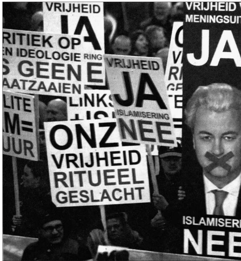
Amsterdam 2010: Proteste für Wilders.

Bei den nationalen Parlamentswahlen im Juni 2010 gelang es Wilders PVV, einen Coup zu landen: Die Partei gewann 24 Parlamentssitze und ist neu die drittstärkste Partei der Niederlande. Über 1,5 Millionen Menschen wählten die PVV. Geert Wilders bemühte sich intensiv, Teil der neuen Regierung zu sein und den Einzug der sozialdemokratischen PvdA zu verhindern. Nicht nur in der Anti-Islam-Agenda, sondern auch in wirtschaftspolitischen Fragen unter-