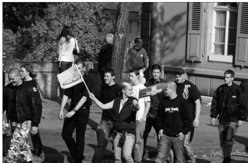
Neonazis zeigen Flagge: SVP Veranstaltung am 06. Oktober 2007 in Bern.

Im Oktober 2009 trat Baettig als Referent an einem rechtsextremen Kongress in der südfranzösischen Stadt Orange auf. Er behauptete danach, im Vorfeld nichts vom rechtsextremen Charakter der Veranstal-