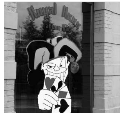
Der Joker hat ausgegrinst.

Die Lichter der «Royal Aces Tattoo-Bar» bleiben somit bis auf weiteres aus. Und es macht nicht den Anschein, als wären die Rechtsextremen gewillt, den Entscheid an eine nächst höhere Instanz weiter zu ziehen.