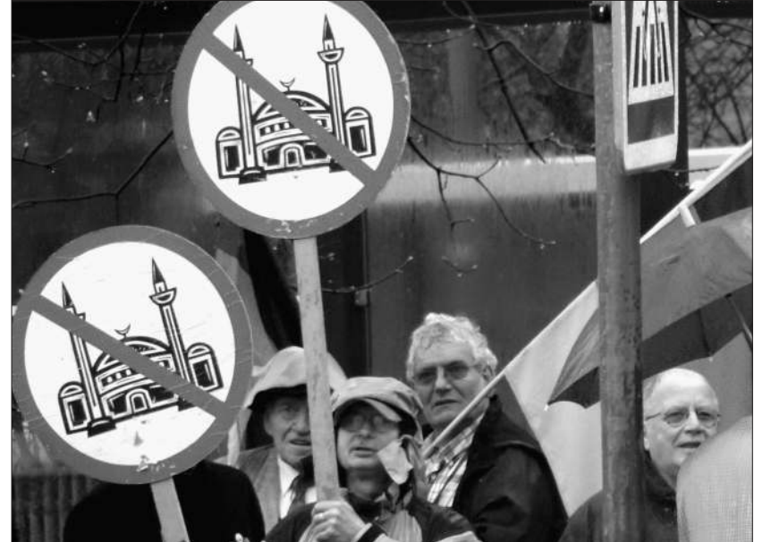
Minarett-Debatte eint die europäische Rechte. «Pro-Bewegung» in Essen.

eigenen Reihen aufzunehmen. Rechtsextremes Gedankengut fliesst so in die Ideologie der Partei ein und wird einem breiteren Publikum zugänglich.